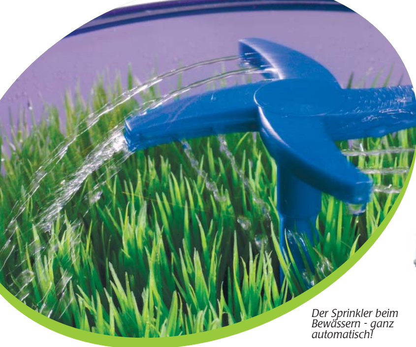
Der Sprinkler beim Bewässern - ganz automatisch!